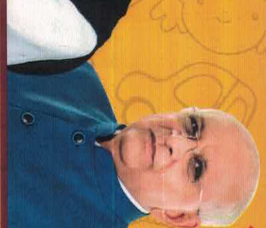
Shri Bhupendra Patel Chief Minister, Gujarat