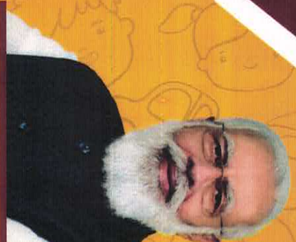
Shri Narendra Modi Prime Minister, Govt. of India