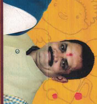
Shri Jitu Vaghani Minister of Education, Science & Technology, Gujarat

Students can register at : www.gujcost.co.in